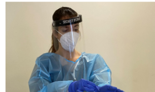
3. Posar-se els guants de manera que quedin per sobre els punys de la bata.