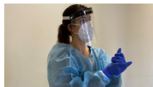
1. Rentat de mans amb solució alcohòlica.