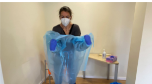
5. Treure's la bata i els guants donant-hi la volta i evitant tocar la cara exterior. Fer-ne una bola i llençar-ho a la bossa de residus proporcionada.