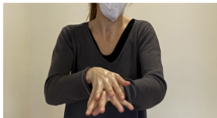
6. Rentat de mans amb solució alcohòlica.