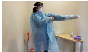
2. Posar-se la bata i cordar-la amb els botons situats al davant.