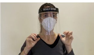
6. Col·locar-se la pantalla facial .