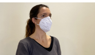
5. Col·locar-se la mascareta FFP2 agafant-la per les gomes i ajustar-la correctament a la cara.