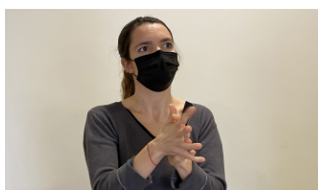
2. Rentar-se les mans abans d'iniciar l'operació amb solució alcohòlica (o aigua i sabó i eixugat amb tovallola de paper d'un sol ús, en cas d'al·lèrgia a la solució alcohòlica).