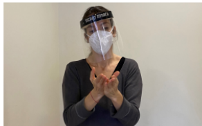
1. Rentat de mans amb solució alcohòlica (o aigua i sabó i eixugat amb tovallola de paper d'un sol ús, en cas d'al·lèrgia a la solució alcohòlica).