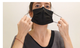
3. Retirar la mascareta que es porti posada de casa agafant-la per la cinta o les gomes i evitant tocar-la per la part del davant.