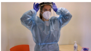
2. Retirar la pantalla facial per la goma del darrere, sense tocar la cara exterior de la pantalla. Llençar-la a la bossa de residus proporcionada.