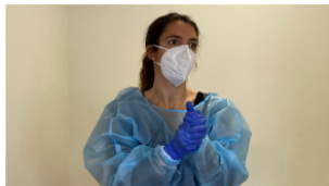
4. Rentat de mans amb solució alcohòlica.