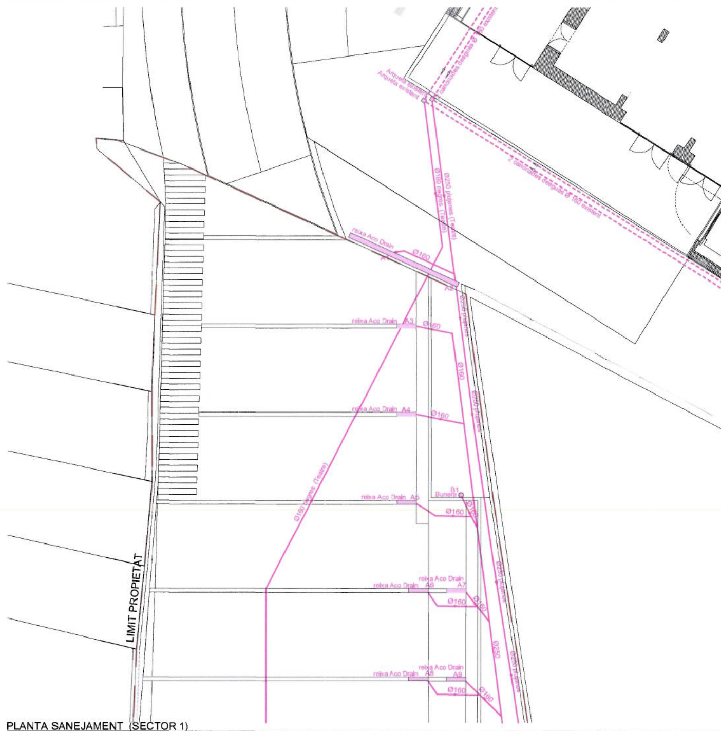
PLANTA SANEJAMENT (SECTOR 1)